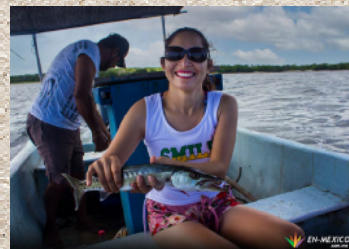
Pesca deportiva , Dzilam de Bravo, Yuc.