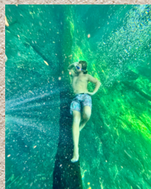
Esnórquel, Dzilam de Bravo, Yuc.