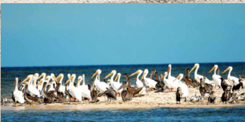
Tours Isla Pajaros Dzilam de Bravo, Yuc.