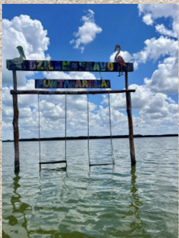
Punta Arena , Dzilam de Bravo, Yuc.