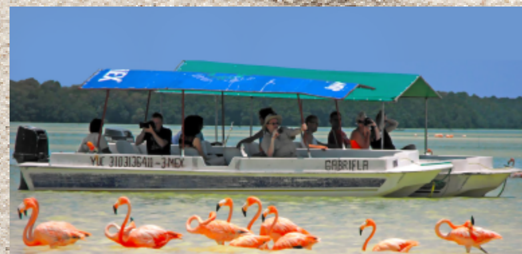
Eco Tour's Argaez , Dzilam de Bravo, Yuc.