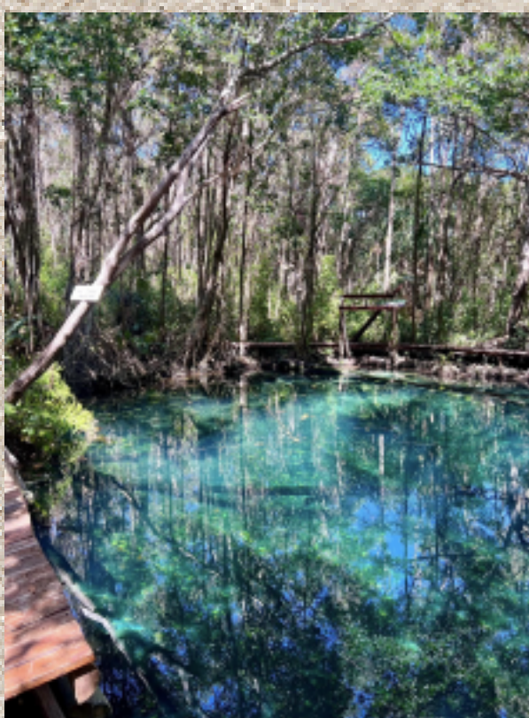
Ojo de Agua, Dzilam de Bravo, Yuc.