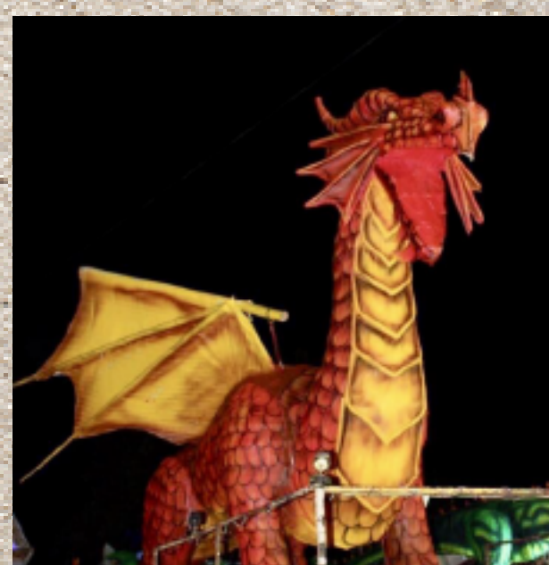
Carnaval, Dzilam de Bravo, Yuc.